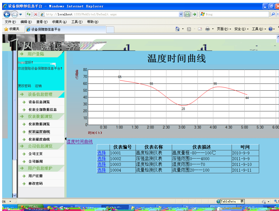
远程浏览运行信息界面